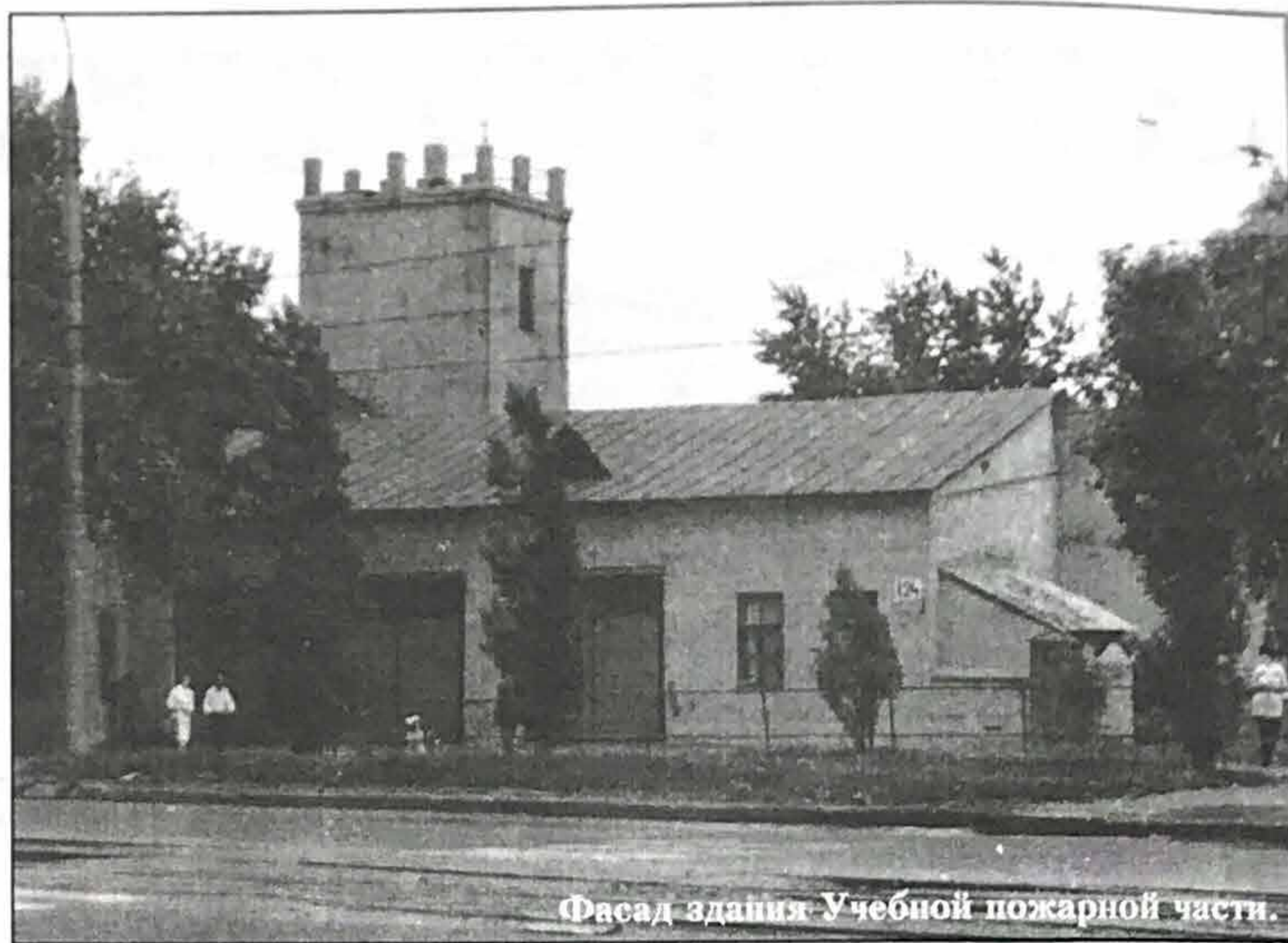
Фасад здания Учебной пожарной части.

В октябре 1984 года Школа подготовки младшего и среднего начсостава была переименована в Учебный центр ПО МВД СССР.